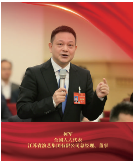
柯军 全国人大代表 江苏省演艺集团有限公司总经理、董事