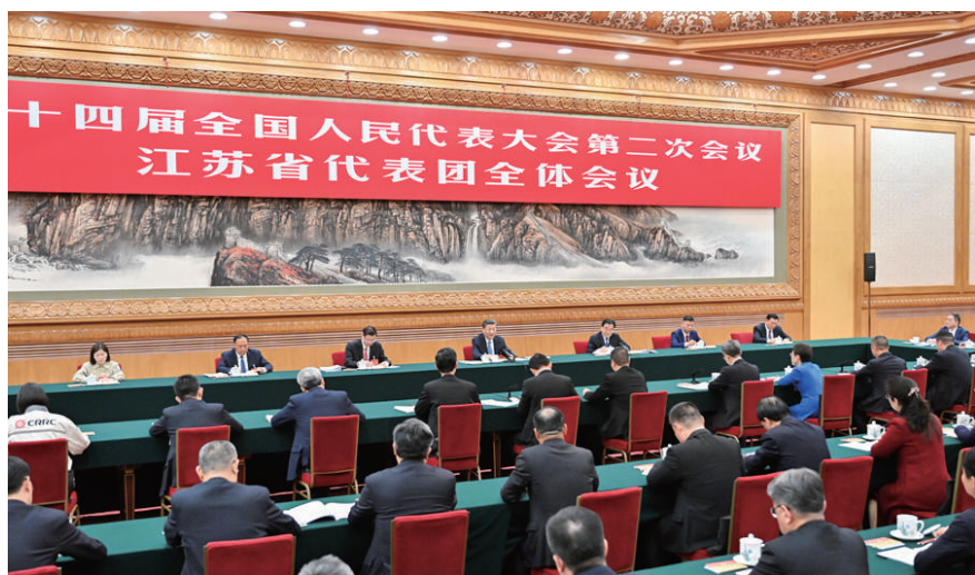
◎3月5日,中共中央总书记、国家主席、中央军委主席习近平参加他所在的十四届全国人大二次会议江苏代表团审议。

习近平强调,江苏发展新质生产力具备良好的条件和能力。要突出构建以先进制造业为骨干的现代化产业体系这个重点,以科技创新为引领,统筹推进传统