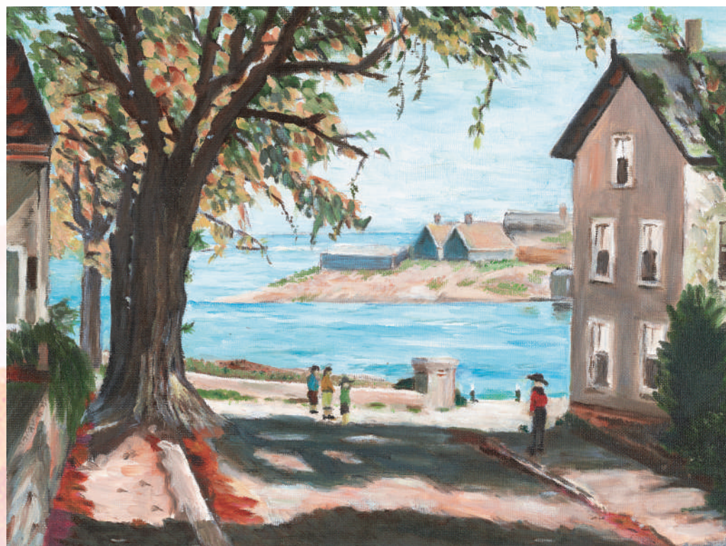
(《岁月静好,人城和谐》 马秋林 省第十三届人大常委会副主任)