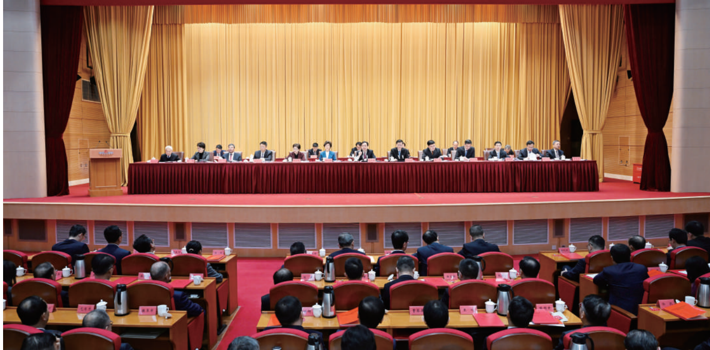
◆ 11月7日,全省科技大会暨全省科学技术奖励大会召开。省委书记、省人大常委会主任信长星出席大会并讲话。