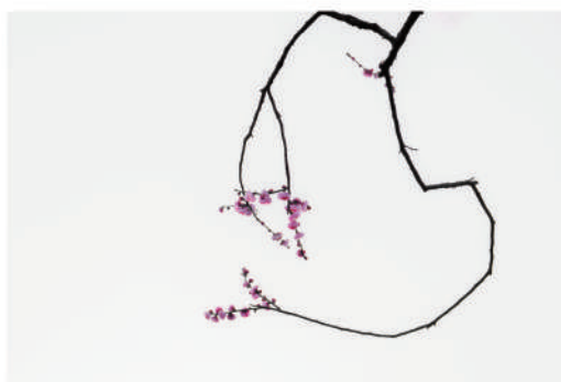
(《梅》 赵龙 省第十届、十一届人大常委会副主任)