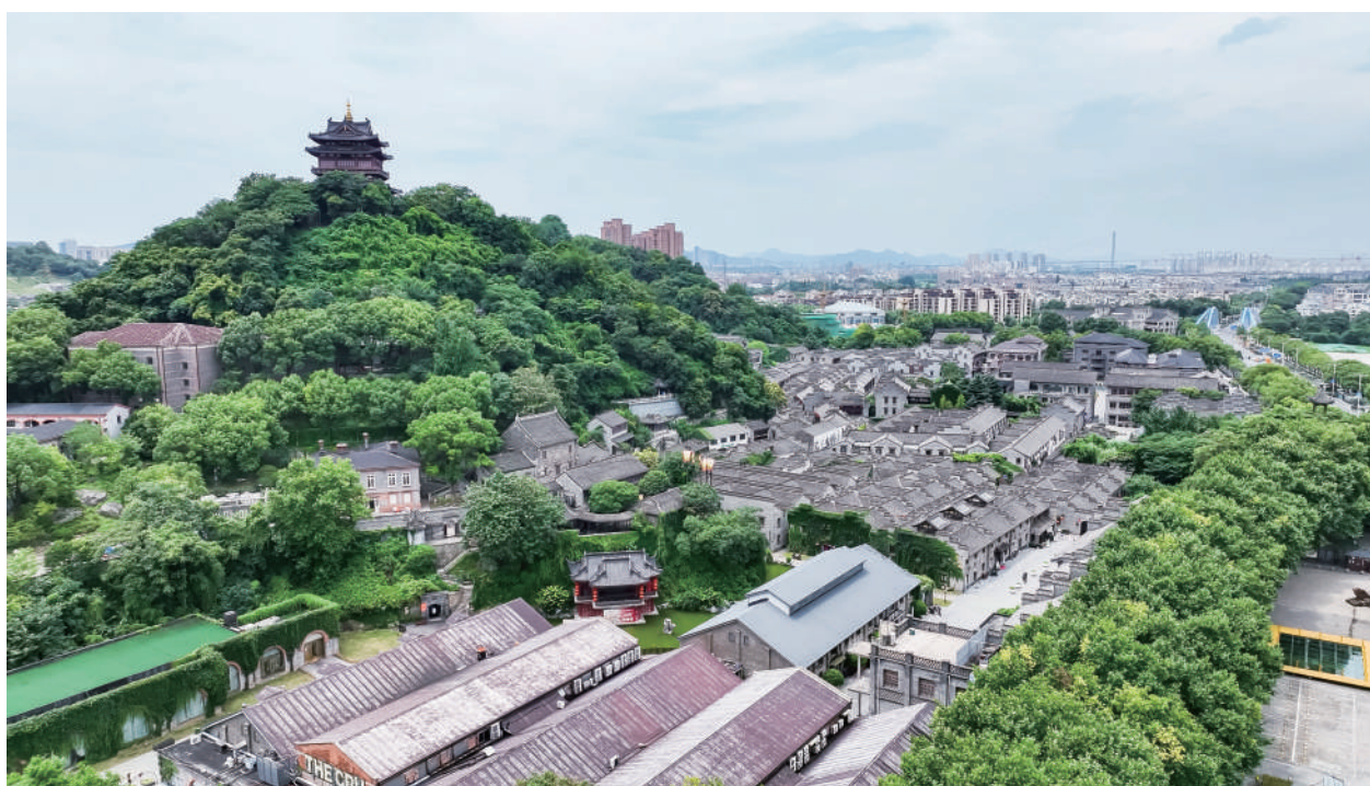
● 镇江市西津渡历史文化街区