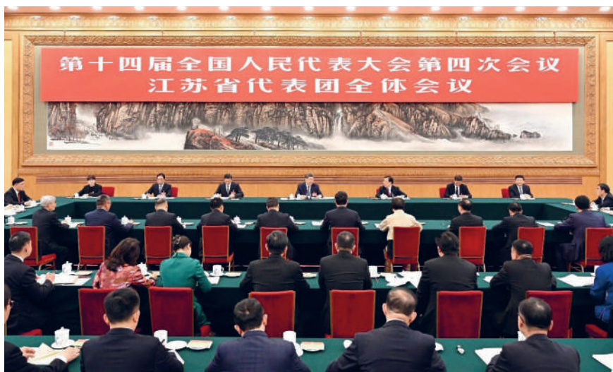
◎3月5日下午,中共中央总书记、国家主席、中央军委主席习近平参加他所在的十四届全国人大四次会议江苏代表团审议。

习近平指出,发展新质生产力对于推动高质量发展、增强经济竞争力至关重要,江苏这方面基础较好,要努力走在前列。要一体推进教育科技人才发展,力争在加强原始创新和关键核心技术攻关、抢占科技制高点上实现新突破,在促进创新链产业链资金链人才链深度融合、推动科技成果高效转化应用上探索新途径,在优化提升传统产业、培育壮大新兴