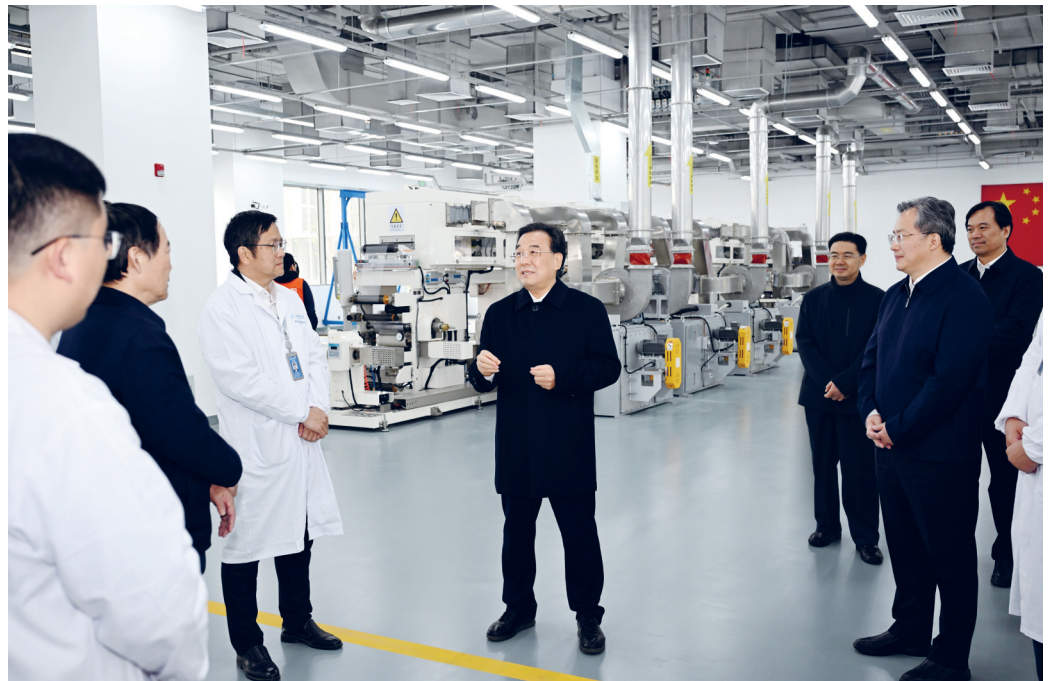
◆ 3月16日至17日,省委书记、省人大常委会主任信长星到苏州宣讲全国两会精神并调研。