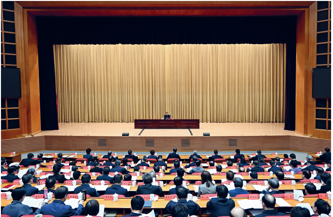
◆ 3月23日至25日,省委举办学习贯彻习近平总书记重要讲话精神、树立和践行正确政绩观学习教育读书班。省委书记、省人大常委会主任信长星在开班式上讲话并主持集中交流。